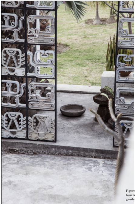
Figurene i jernlågen ved husets indgang ligner oldgamle mexicanske symboler.

Open vue – ingen vægge eller hegns skjemmer det fantastiske landskab omkring huset.