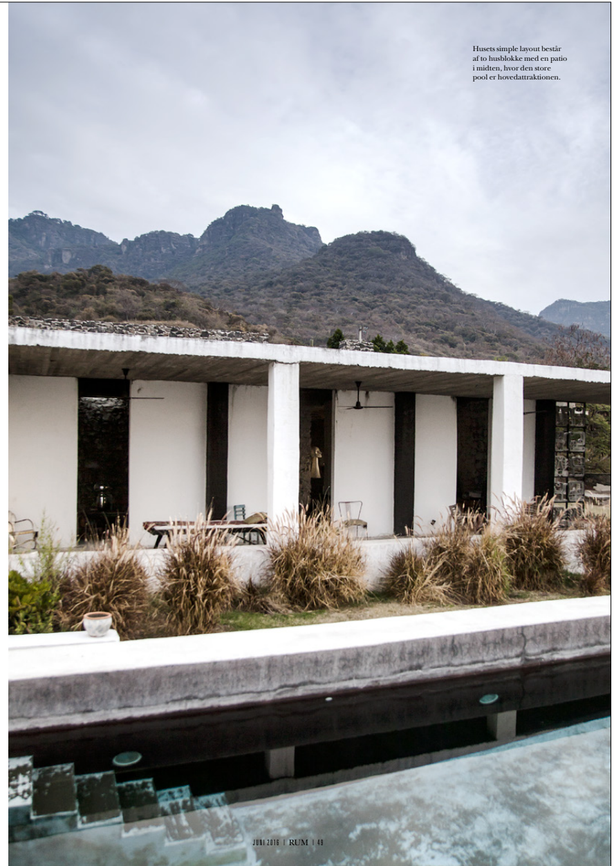
Husets simple layout består af to husblokke med en patio i midten, hvor den store pool er hovedattraktionen.