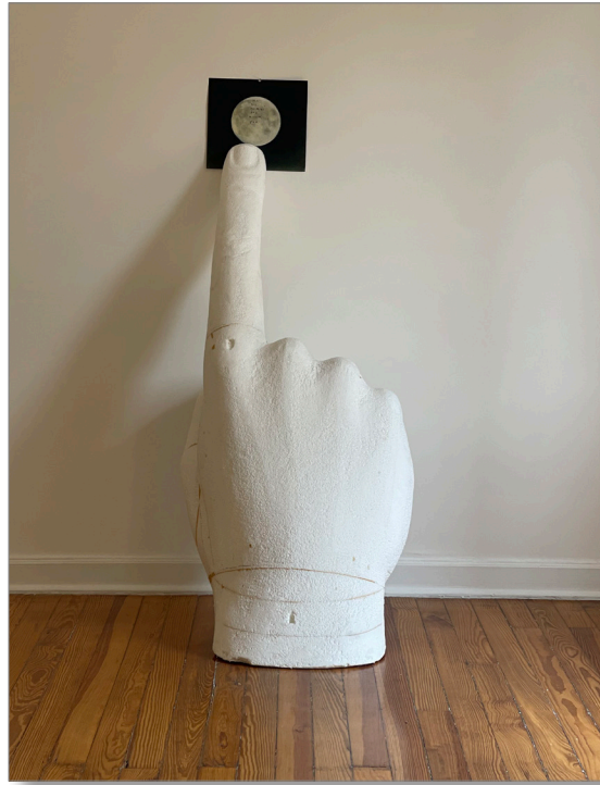
Mano, por Freidrich Kunath, en Travesía Cuatro.